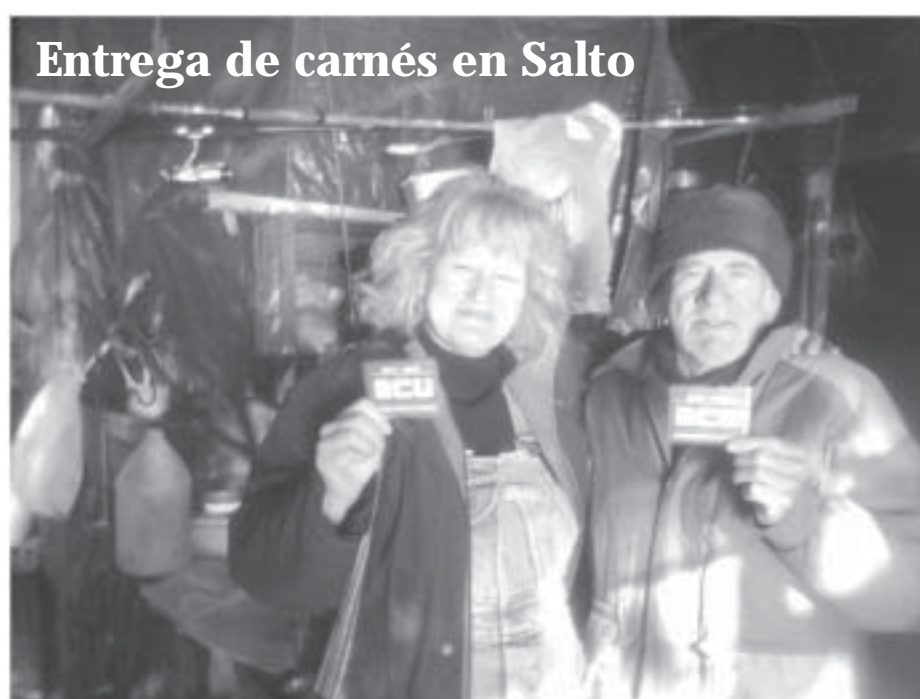
Entrega de carnes en los ranchos a orillas del río Uruguay. Pescadores artesanales reciben orgullosos el carne del Partido Comunista.